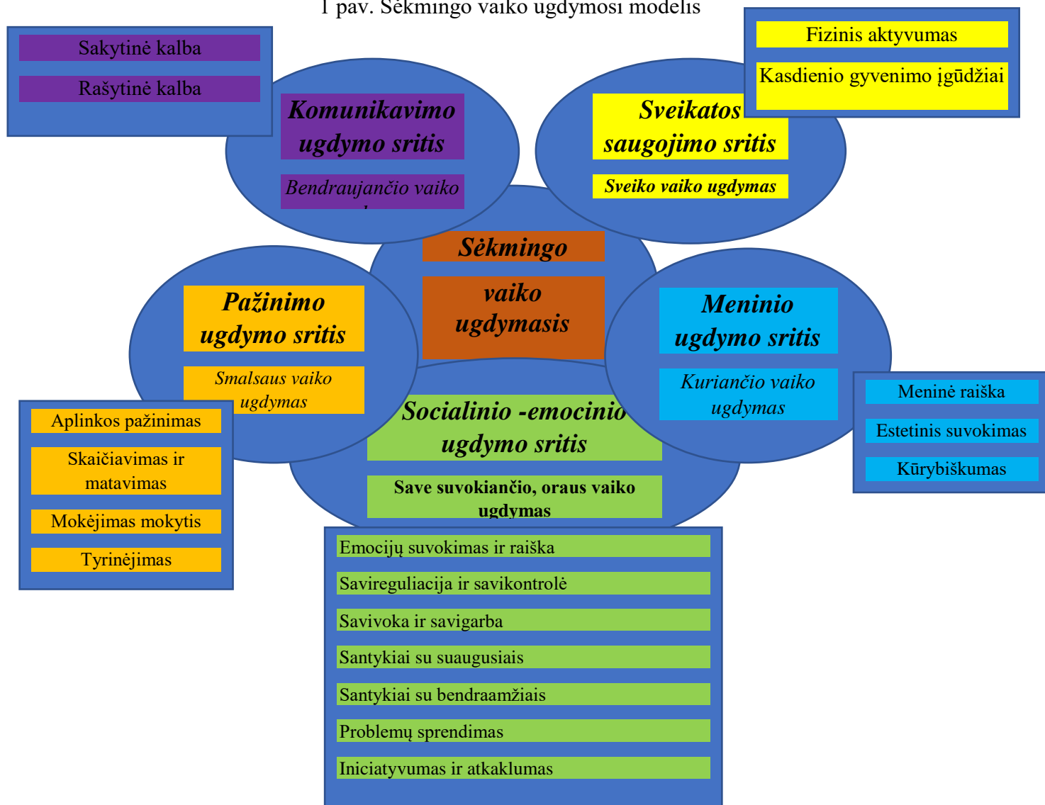
1 pav. Sėkmingo vaiko ugdymosi modelis

Vaikų gebėjimų ugdymo tęstinumą garantuoja Priešmokyklinio ugdymo ir ugdymosi programa (2014), kurioje numatomas vaiko ugdymas pagal penkias kompetencijas: socialinę, pažintinę, komunikavimo, meninę ir sveikatos saugojimo.