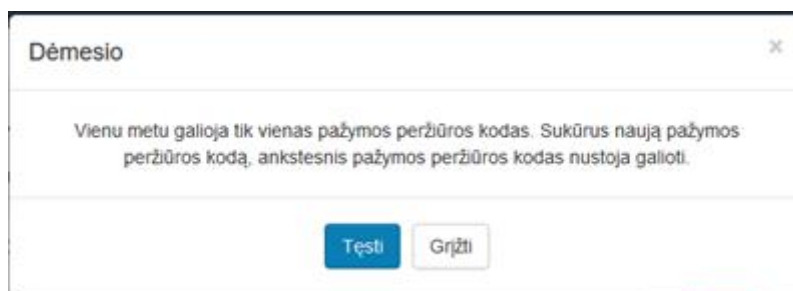
2 paveikslas. Pasirinkti tęsti veiksmą

Sistema sugeneruoja naują pažymos peržiūros e. sveikatos portale kodą, kuris rodomas atnaujintame medicininės pažymos peržiūros lange.