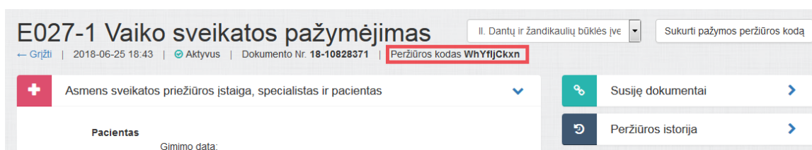
3 paveikslas. Sugeneruotas peržiūros kodas

Sistema sugeneruoja naują pažymos peržiūros e. sveikatos portale kodą, kuris rodomas atnaujintame medicininės pažymos peržiūros lange.